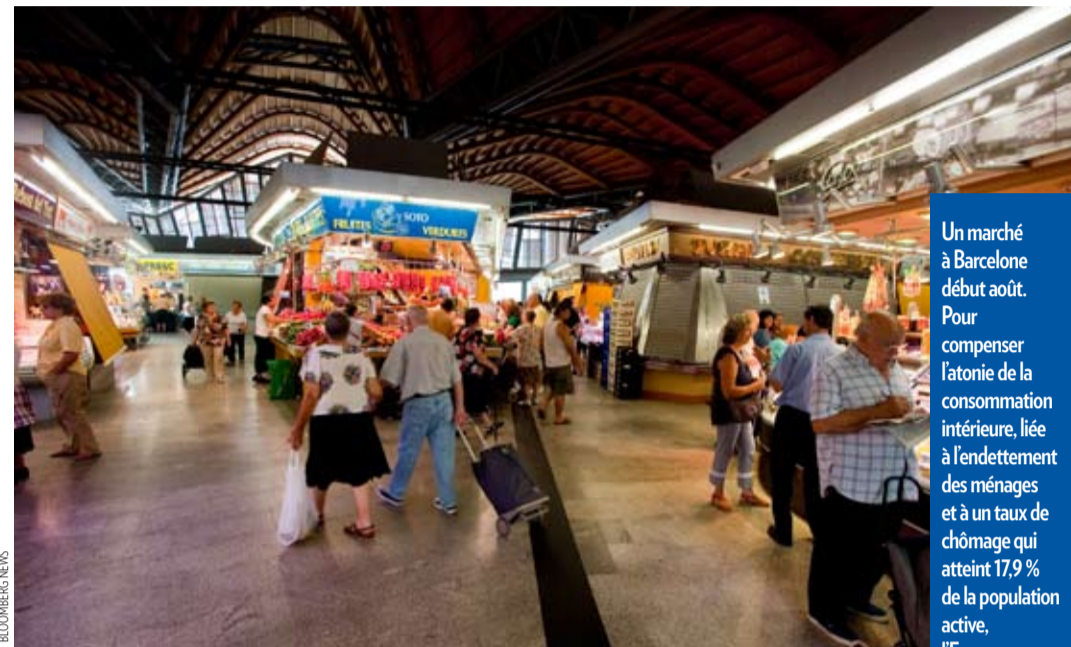
Un marché à Barcelone début août. Pour compenser l'atonie de la consommation intérieure, liée à l'endettement des ménages et à un taux de chômage qui atteint 17,9 % de la population active, l'Espagne ne peut pas tabler sur une reprise par les exportations.

Les derniers indicateurs rendus publics à Madrid reflètent certes une facette positive : si la détérioration économique se poursuit, c'est désormais à un moindre rythme. Dernier en date, le chiffre des crédits douteux et impayés qui, après avoir grimpé régulièrement durant deux ans, s'est pour la première fois stabilisé en juin, atteignant 4,59 % du total